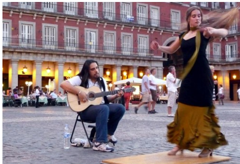
Blue moon in her eyes

La città che non dorme non si è forse mai calmata un po' negli ultimi anni. Ma anche se i bar oggi chiudono prima si può star certi che l'atmosfera festosa rimane, giorno e notte, sempre. E quando ci si stanca di stare in compagnia ci si può dedicare qualche giorno al chilometro artistico più importante d'Europa.